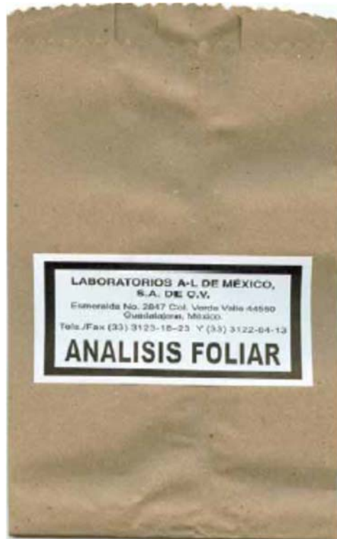
Imagen 2.- Bolsa de Laboratorios A-L de México para la recolección de muestra de planta para el análisis foliar.

Una vez realizados los análisis del estado de nutrición de las hojas, la interpretación de éstos resultados para cada elemento se lleva a cabo comparando los datos contra los rangos de valor del cultivo. En cada cultivo se manejan varias diferentes etapas vegetativas a las que corresponden diferentes rangos. Estas etapas varían según cultivo pudiendo, por ejemplo, ser las siguientes: