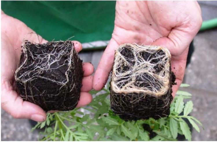
Raíces no micorrizadas (izquierda); raíces micorrizadas (derecha).

El origen etimológico del término " micorriza " proviene del griego " mykos " (hongo) y del vocablo latino " rhiza " (raíz). Se dice que las micorrizas son asociaciones simbióticas mutualistas entre las raíces de las plantas terrestres y ciertos hongos del suelo. Su existencia se conoce desde 1885, pero fueron consideradas curiosidades excepcionales. Hoy se cree que más del 97% de especies vegetales terrestres están