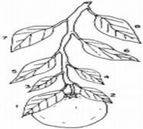
FIGURA 1. Localización de hojas para el muestreo foliar en cítricos. Las hojas 1, 2 y 3 son las que se deben tomar. Las hojas 5, 6, 7 y 8 son más viejas; no se deben tomar para el análisis.

La muestra se recomienda enviarla a Laboratorios A-L de México por la vía más rápida (DHL, Estafeta, etc.). Los resultados se entregan por vía e-mail, fax o mensajería, en un plazo no mayor a 9 días hábiles desde que llega la muestra a Laboratorios A-L de México.