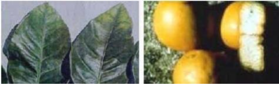
Imagen 3.- Deficiencias de Potasio en limón persa.

- Caída exagerada de frutos. (Ver Imagen 3).