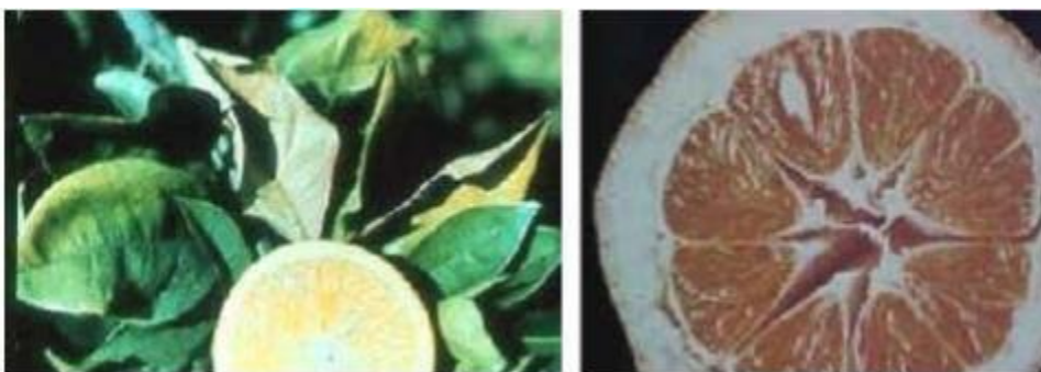
Imagen 2.- Deficiencias de Fósforo en limón persa.