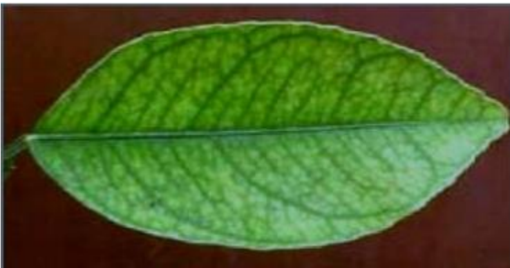
Imagen 7.- Deficiencias de Hierro en limón persa.