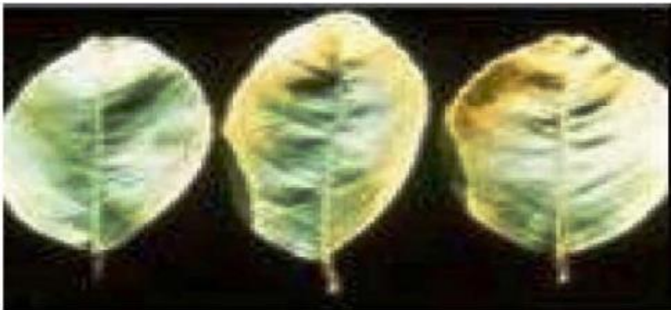
Imagen 4.- Deficiencias de Calcio en limón persa.

- Al inicio ocurre un amarillamiento en la orilla de las hojas jóvenes maduras que luego avanza del borde hacia el interior de la hoja. (Ver Imagen 4).