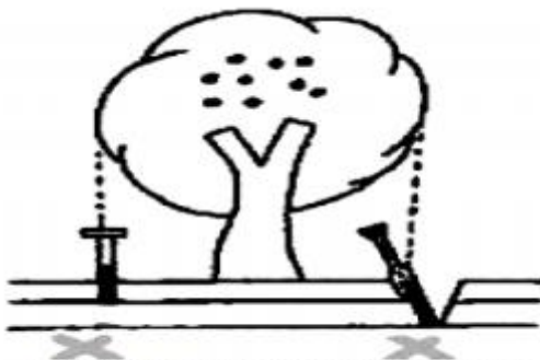
Figura 2. Localización de zona para tomar el muestro de suelo en cítricos. "Food & Fertilizer Technology Center", 5F-14 Wenchow St., Taipei 10616 Taiwan R.O.C.

Posición de la muestra de suelo. Hay que tomarlas directamente debajo del árbol. Dos muestras de suelo por separada deben ser tomadas, una de la capa superficial del suelo y una del subsuelo. (Ver Figura 2).