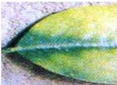
Imagen 5.- Deficiencias de Magnesio en limón persa.

- Con una fuerte deficiencia se conserva solo una parte verde en la base de las hojas en forma de una "V" invertida. (Ver Imagen 5).