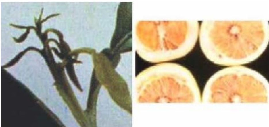
Imagen 10.- Deficiencias de Boro en limón persa.