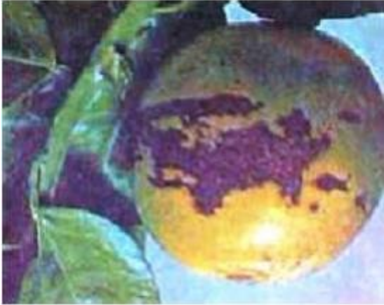
Imagen 8.- Deficiencias de Cobre en limón persa.