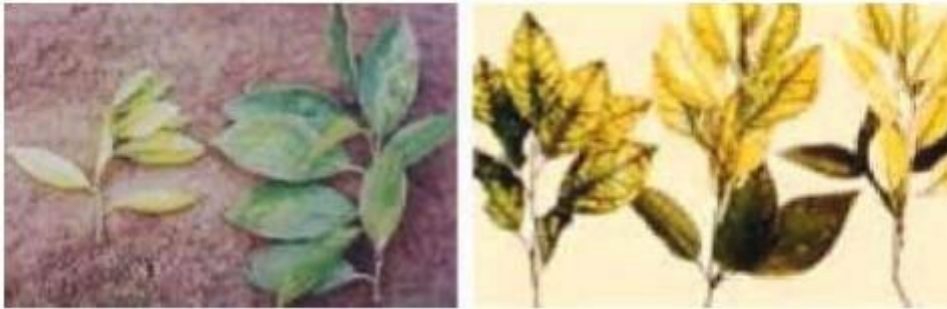
Imagen 6.- Deficiencias de Zinc en limón persa.