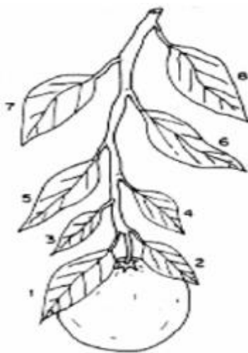
Figura 1. Localización de hojas para el muestreo foliar en cítricos. Las hojas 1, 2 y 3 son las que se deben tomar. Las hojas 4, 5, 6, 7 y 8 son más viejas; no se deben tomar para el análisis. (Chapman, 1960)

La muestra se recomienda enviarla a Laboratorios A-L de México por la vía más rápida (DHL, Estafeta, etc.). Los resultados se entregan por vía e-mail, fax o mensajería, en un plazo no mayor a 9 días hábiles desde que llega la muestra a Laboratorios A-L de México.