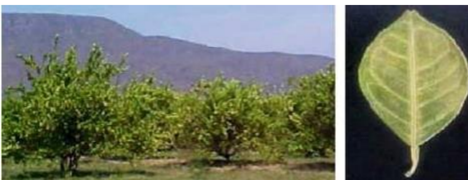
Imagen 1.- Deficiencias de Nitrógeno en limón persa.