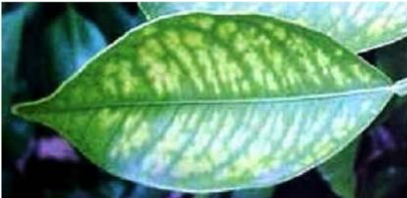
Imagen 9.- Deficiencias de Manganeso en limón persa.