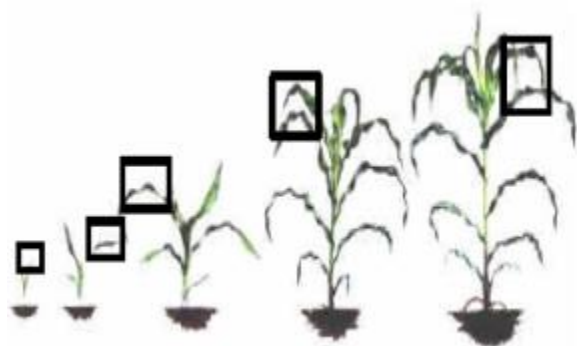
Imagen 1. Si la planta de maíz tiene menos de 40 cm de altura (plántulas); tomar al azar 5 a 8 plántulas, dentro del lote uniforme, cortadas a 5 cm de la base del cuello.