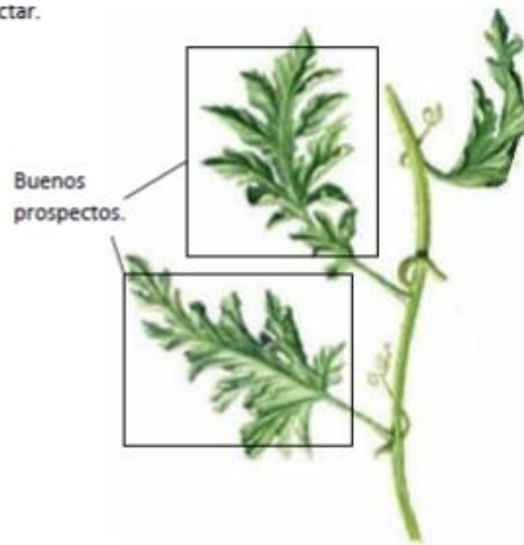
Imagen 2. Planta de Sandía