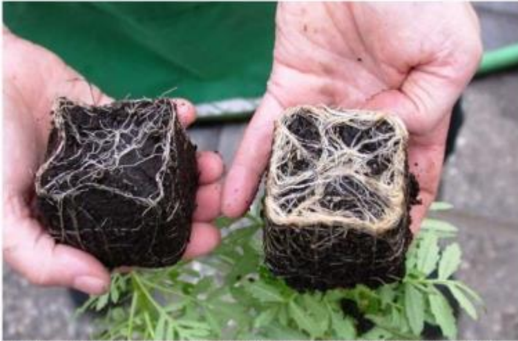
Raíces no micorrizadas (izquierda); raíces micorrizadas (derecha).

micorrizadas . Se dice que es una "asociación mutualista" dados los beneficios que reporta la misma para ambos participantes. Comprende la penetración radical por parte del hongo y la carencia de respuesta perjudicial hacia éste por parte de la planta hospedera.